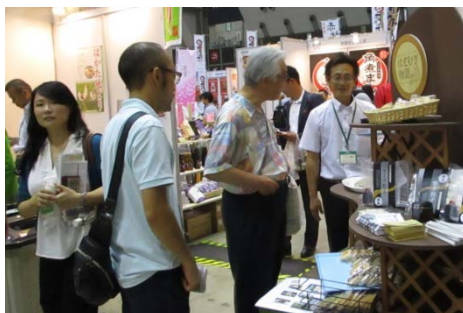
▲8/18 東京ビッグサイトで開催されたアグリフードEXPOの出展の様子

【注】研究開発商品の今年度中の販売は、テスト販売で、実販売は来年度以降になります。